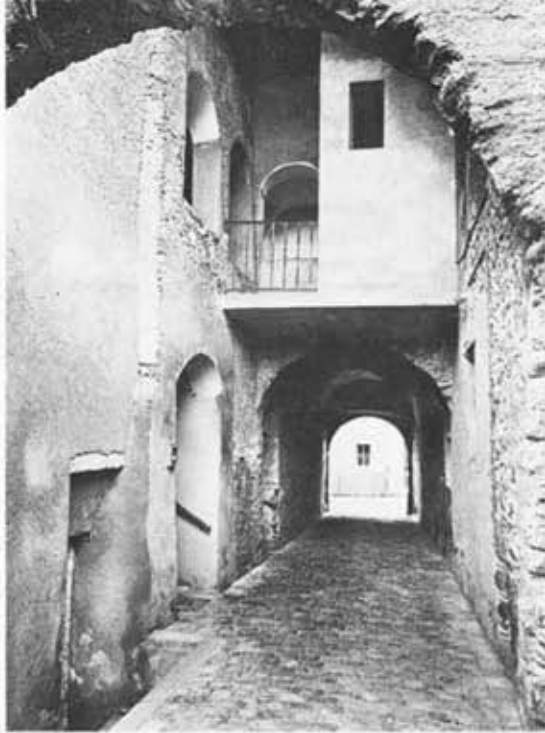
Martigny, maison Supersaxo - Passage.