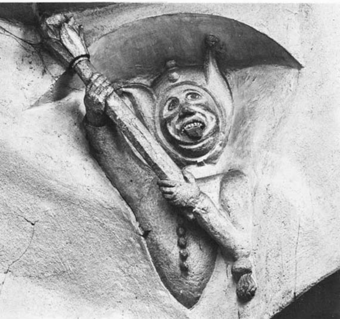
Sion, maison Supersaxo. Fou, détail de l'escalier.