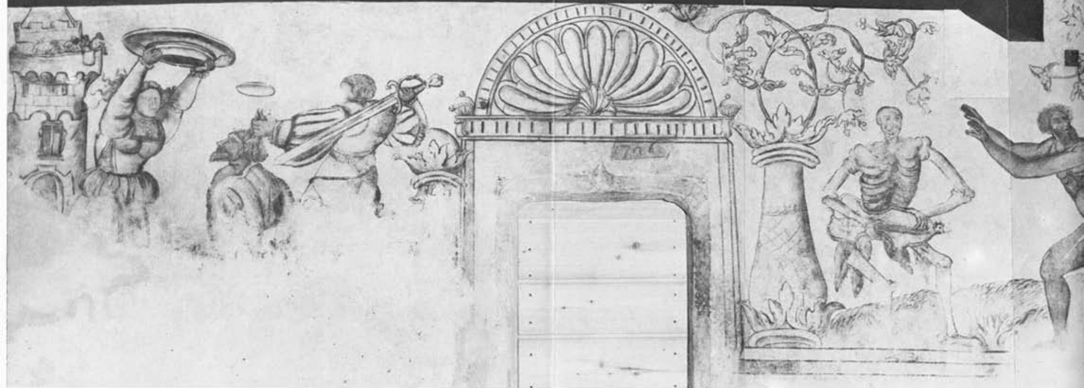
5. L'enseigne du pharmacien Uffem Bort