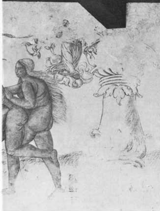
Eve pour aller vers la Mort