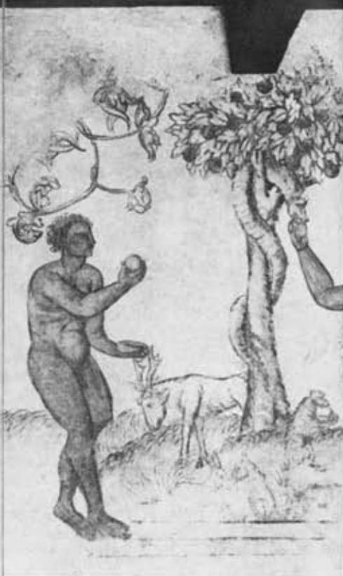
2. Eve cueillant la pomme et Adam mangeant le fruit défendu