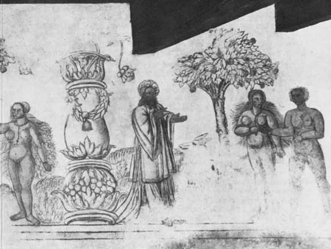
1. Dieu présente l'arbre de Vérité à Adam et Eve